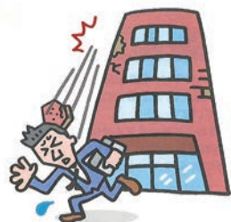
[通行人の死傷など]